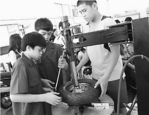
学生在汽修班学习

据新华社北京10月27日电（记者齐湘辉）商务部台港澳司最新统计显示，今年1至9月，内地与澳门贸易额为35.6亿美元，同比上升35.2%。其中，内地对澳门出口为34.2亿美元，同比上升37.4%；自澳门进口为1.4亿美元，同比下降2.4%。 在吸收澳资方面，内地共批准澳商投资项目306个，同比上升15%，实际使用澳资金额7.5亿美元，同比上升75.6%。 在对外经济合作方面，内地在澳门承包工程合同数共计25份，金额13.7亿美元，完成营业额8.2亿美元，截至9月底在澳劳务人数117902人。