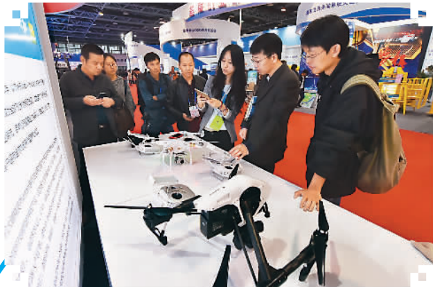
图为“双创周”活动现场。