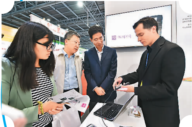
图为来自海外的创业者介绍产品。