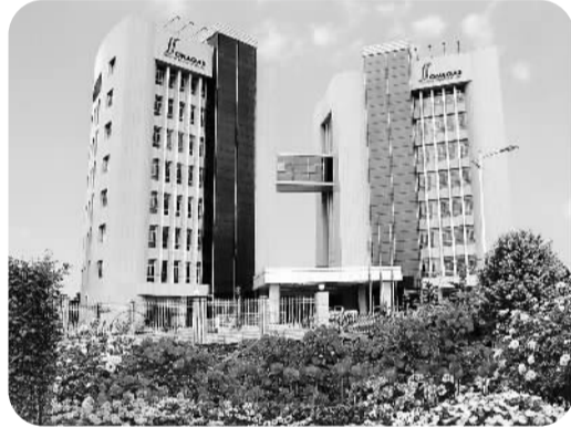
赤道几内亚国家天然气公司总部办公大楼