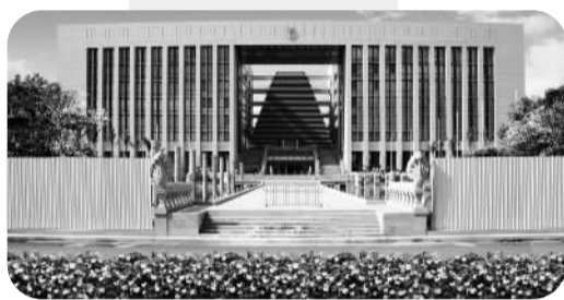
柬埔寨政府办公大楼