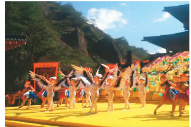
浙江缙云举行祭祀大典，海内外华人共祭轩辕黄帝。

据了解，本次祭祀大典为浙江缙云2015“寻梦乡愁”生态养生旅游季活动之一，至12月31日期间，缙云将举办特色小吃（缙云烧饼）品鉴会、民间婺剧品鉴会、网货展销（网商接洽）会、中国华侨国际文化交流基地揭牌仪式、“寻根乡愁”仙都游等活动，以进一步扩大缙云黄帝文化的凝聚力、黄帝养生文化的影响力，全面展示缙云良好的生态环境、秀美的自然风光、独特的民间文化以及和谐的创业环境。