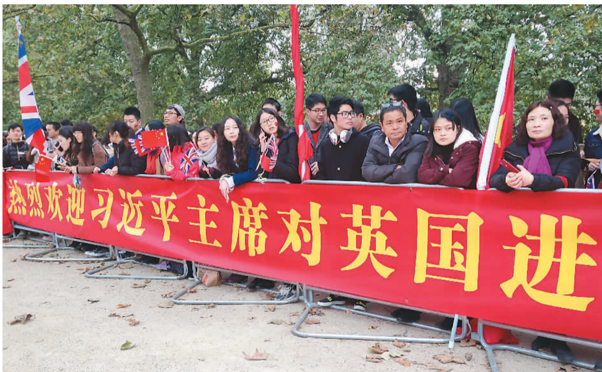
英国的华侨华人及留学生在白金汉宫外欢迎习近平夫妇。

郝斐同样认为：“习近平来访的影响是多方面的，不是单纯的国事访问，具有持续性。今年正值中英文化交流年，中英教育、文化、商务等方面的沟通更加深入了一步。刚公布将于明年施行的签证政策，无论是对于来