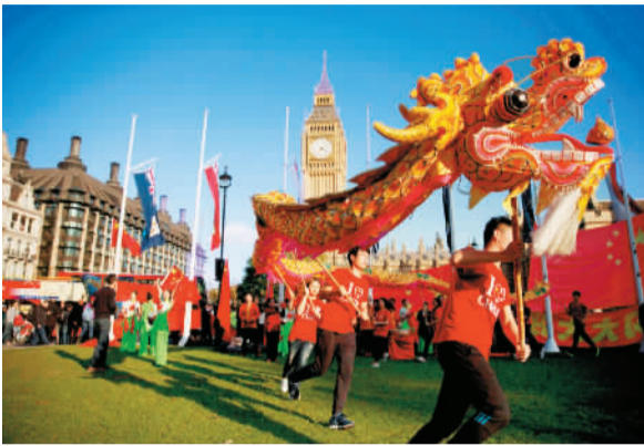
在英华侨华人欢迎习近平来访。

“交流多了，来英国的人肯定也会多了。在各个领域，尤其在教育和文化方面将给英国华侨华人带来更多的机会和利益。”何其华说，两国人民的各项交流带来的是黄金时代，是共同繁荣的契机。你中有我，我中有你，互补发展，共同前进。