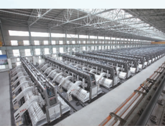
全球首条全系列600KA原铝生产线，该槽型具有单槽容量大、吨铝投资最少、液态铝质量好、能耗低等优势，直流电耗每吨铝低于12500度，烟气净化效率达到99.8%以上，整体技术达到国际领先水平。

配套优势。 全县涉铝产业主要集中在邹平经济技术开发区，这是山东省第一家设在县级的国家级经济技术开发区，配套功能完备。鲁中运达保税物流中心与铝业基地相邻，是山东省首个设在县级