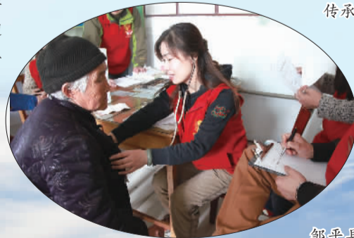
邹平县“大爱”志愿者每月为山村留守老人进行体检，传递温暖关怀。