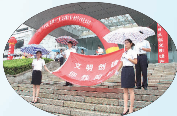
开展“文明创建 你我同行”万人签名暨文明交通劝导行动。

文明交通劝导为先导，积极开展各类文明劝导活动，引导群众在卫生习惯、礼仪交往、文明举止、礼貌用语、遵守公德、保护环境等方面自觉规范改进，营造全社会讲文明、树新风的良好氛围。此外，精心组织开展全民阅读、礼仪邹平、文明家庭创建、邻里一家亲、志愿服务等活动，全方位搭建群众参与创建工作的平台，让市民在参与中展示风范，在实践中提高素质。大力弘扬“奉献、互助、友爱、进步”的志愿者精神，发挥好志愿服务的社会动员和教化作用，让大家在志愿服务中奉献爱心、陶冶情操、提升境界。截至目前，邹平县注册志愿服务队伍达50余支，志愿者注册人数达10000余人，每年组织开展多种形式的志愿服务活动近千次，“志愿服务你我他，美好生活新常态”的良好社会风气正逐渐养成。同时，丰富化文明实践的具体路径，让群众了解什么是文明、践行文明应该干什么，潜移默化去影响人、塑造人。