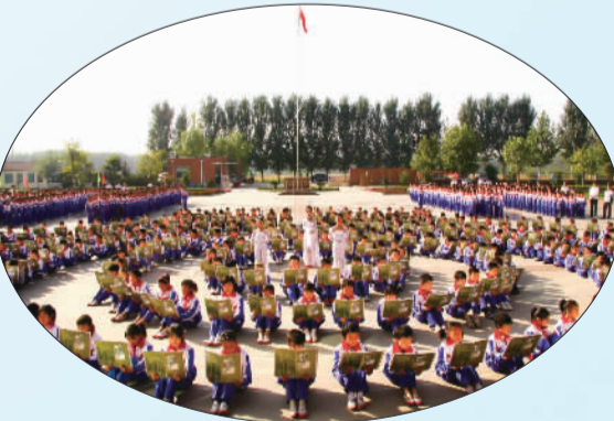
大力开展经典诵读活动，传承优秀传统文化美德。