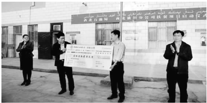
柯坪县盖孜力克村文化大礼堂、标准化畜牧养殖合作社项目启动仪式。

柯坪县委书记柯旭表示：“这两个总投资为427万元的援建项目对柯坪人民而言是双喜临门，是西北石油局主动担当依法治疆、团结稳疆和长期建疆责任的完美体现。今年西北石油局进一步加大帮扶工作力度，‘访惠聚’工作组解决了一大批群众关心的热点、难点问题，各项工作得到了新疆各级政府和各族人民的一致好评。”