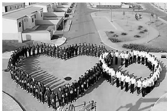
图为中安籍员工在赞谷项目合影。

7月10日下午，随着葡萄牙总理艾世表郑重地在最后一份验收报告上签下名字，在经过3年的建设之后，新疆生产建设兵团建工集团北新国际公司安哥拉区赞谷项目14个地块的房建工程终于顺利交验。