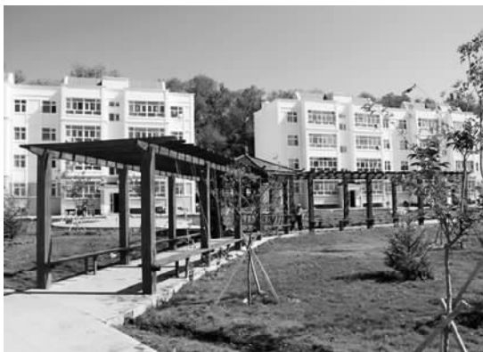
阜康居民小区一角。

园是政府给予百姓生态福利的样本。这座开放式游园位于城市新区核心地带，如果用来做商业开发，市财政至少能增加1.5亿元的收入。阜康市却“忍痛割爱”，放弃了这笔收入，转而挤出4.1亿元，历时3年，为市民建成了一个休闲娱乐的好去处。与水磨滨河景观带游园隔路相望，一座现代化标准运动场正在加紧建设，它将与已经投入使用的文体中心一起，为阜康百姓提供更多更好的健康文化食粮。