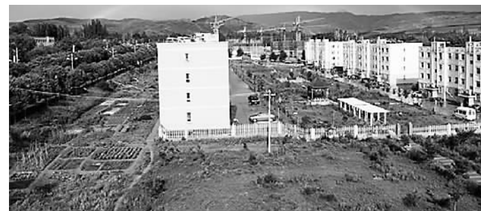
建设中的职工保障性住房。

据了解，在城镇化建设上，一六五团将不断加大资金投入力度，以改面貌、促发展、铸和谐为前提，继续实施亮化、美化、绿化工程，切实整治脏、乱、差现象。以布局合理、设施配套、环境整洁、面貌优美为目标，力争在抓投入、创特色、显亮点上取得新的成效。