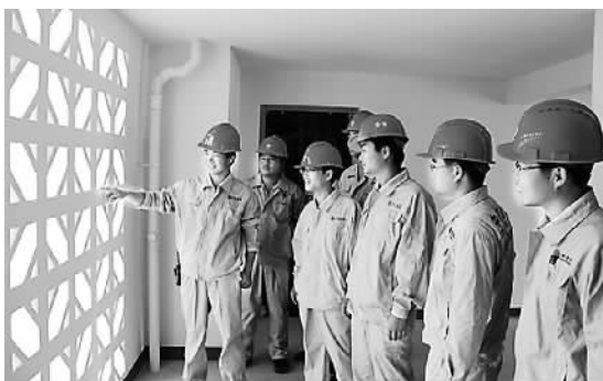
赞谷项目部工作人员进行质检。

3年来，兵团建工集团北新国际公司的建设者们充分发扬兵团精神和“奉献、创新、融合、幸福”的北新国际企业精神，克服了文化差异、人员缺乏、资金周转困难等一系列难题，最终提前50天实现14个地块房建工程的顺利交工。