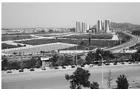
图为紧连泛亚铁路的腾俊国际陆港。

云南省副省长高树勋在视察该企业时，对“腾俊国际陆港”作出极大肯定，他说，腾俊区位优势显著，立体交通体系完备，建设标准高，既能借助滇中产业新区发展的东风，促进项目的腾飞，又能丰富产业新区的业态，为新区的建设添砖加瓦。“京东商城”等一批知名企业选择“腾俊国际陆港”作为合作伙伴是强强联合，下一步，“腾俊国际陆港”作为昆明铁路口岸的分作业区纳入昆明铁路口岸监管服务范围，通过大物流带动大商贸，抢占商机，利用物流、人流、资金流、信息流的全面流通，为云南辐射中心建设做贡献。