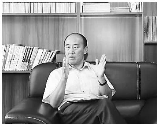
图为云南省交通厅厅长刘一平与本报对话。

刘一平：云南省委、省政府启动基础设施“五网”建设五年会战的当天，滇中经济圈3条高速公路（武定至易门、江川至通海、功山至东川）同日开工建设，意味着云南高速公路五年会战拉开了序幕。