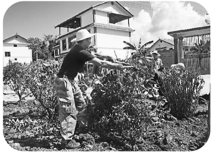
图为永平镇七七村村民正在绿化新家园。