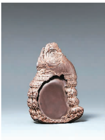
“惟砚作田：上海博物馆藏砚粹展”陈端友制笋形端砚