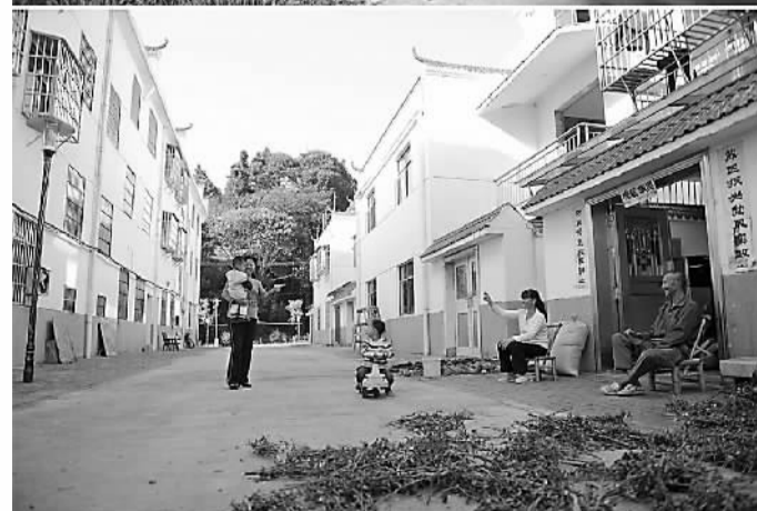
江西广昌，贫困村焕发新生机。上图：贯桥村内的几处土坯房。下图：10月13日，在贯桥村旁的统一安置点，村民们在家门口聊天。