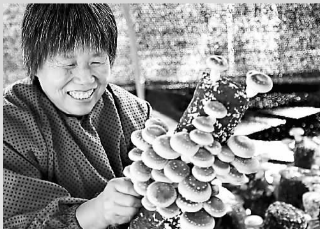
10月6日，河北省新河县刘秋村农民在利用扶贫资金建起的大棚内采摘香菇。

“中国对全球减贫的贡献率超过70%。”10月12日，在国务院新闻办的发布会上，李春光列举了一系列的数字。按照中国现行扶贫标准衡量，中国农村贫困人口的比例，从1990年的73.5%，下降到2014年的7.2%。按照联合国2015年《千年发展目标报告》的数字，中国农村贫困人口的比例，从1990年的60%以上，2002年下降到30%以下，率先实现比例减半，2014年下降到4.2%。