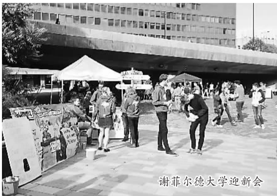
谢菲尔德大学迎新会

启德教育集团日前在京发布《中国留学生跨文化适应调查报告》，根据该《报告》，逾六成中国留学生社会文化适应较好。在社会文化适应各维度上，中国留学生在日常生活方面得分最高，在人际交往方面得分最低，人际交往仍是中国留学生跨文化适应面临的大难关。