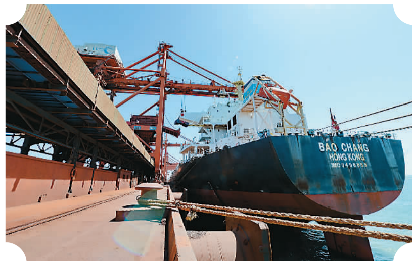
图为一艘轮船靠泊在唐山港曹妃甸港区矿石码头卸载。

曹妃甸拥有天然良港和大量土地资源，与首钢、北控等北京市属企业有着良好的产业合作基础，在共建产业转移对接平台、承接非首都功能产业疏解方面具有得天独厚的优势。2014年7月，京冀两省签署共同打造曹妃甸协同发展示范区框架协议。今年4月，中共中央政治局会议通过的《京津冀协同发展规划纲要》对曹妃甸提出了明确定位，即要打造世界一流石化基地、建设国家原油战略储备库、京冀共建曹妃甸协同发展示范区、打造现代产业发展试验区、将天津滨海新区政策延伸至曹妃甸。 北京市经济和信息化委员会主任张伯旭介绍：“北京市委市政府高度重视示范区建设，去年7月31日，北京市与河北省签署了《共同打造曹妃甸协同发展示范区框架协议》，决定在产业合作中首先聚焦曹妃甸，将曹妃甸协同发展示范区作为京津冀协同发展重点打造的四个战略功能区之一，将北京（曹妃甸）现代产业发展试验区作为深入落实京津冀协同发展战略的重要突破口。”