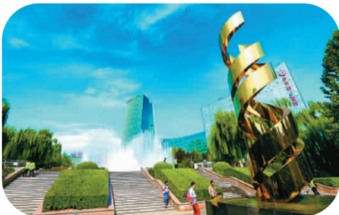
在中关村广场上，生命螺旋大型雕塑、绿树喷泉、高层建筑与蓝天白云交相辉映。

中关村大街有了新的规划图。10月11日，在“中关村创新创业季（2015）”活动开幕式上，“中关村大街发展规划”正式发布。未来3—5年，中关村大街将彻底告别传统电子卖场业态。昔日的“中关村电子一条街”将转型升级为“创新创业一条街”，到2017年底，形成一批创新创业、科技金融、文化创意等新型业态集聚区。