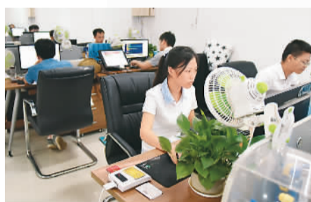
图为赣州科睿特软件技术有限公司一角。

目前，赣州市已经从一个电子信息产业较弱的城市变为发展较快的城市，“小步快走”的后面是当地政府的规划引导，产业政策的完善，以及企业的技术创新。近日，笔者在赣州采访，感受该市电子行业前行的力量。