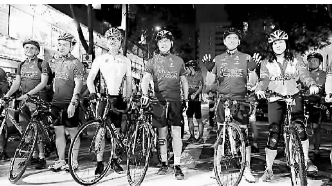
首届香港自行车节10月10日拉开帷幕,举行了总裁慈善自行车游、男子公路绕圈赛、女子公路绕圈赛、国际专业公路绕圈赛等项目。图为各车手蓄势待发。