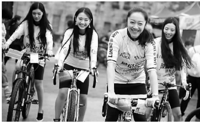
“梦想爱—2015台湾发现之旅”招募骑行爱好者活动日前启动。从婉转绚丽的海边公路到极富挑战的山地骑行,骑行者们将探索深藏在大山纵谷的台湾之美。