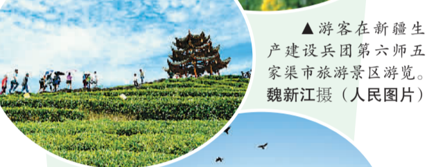
▲游客在新疆生产建设兵团第六师五家渠市旅游景区游览。

云南丽江全面接入“支付宝”服务, 游客购物休闲可实现全城手机支付费用, 使其成为中国第一座“无现金”古城。九华山联合微信客户端推出“微信支付狂欢节”, 游客只需使用手机扫描二维码或微信“摇一摇”功能, 即可半分钟完成一键购票。苏州推出“旅游厕所移动服务与管理平台”, 平台覆盖75家景区、652个旅游厕所, 通过扫描二维码, 游客在手机上即可找到距离最近的厕所。安徽黄山通过车牌自动识别系统实时获取进出景区的车辆数量及车辆客源地等信息, 实现动态调控。济南趵突泉公园采用红外线客流统计系统, 实时统计入园客流量, 根据大数据有针对性地对重点地区的人工监测和疏导。