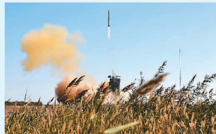
“吉林一号”商业卫星发射升空。

这4颗卫星均由长光卫星技术有限公司负责研制和商业化运营。卫星入轨并开展工作后, 该公司将通过在线和离线方式向国内外用户提供卫星遥感数据和各种产品。