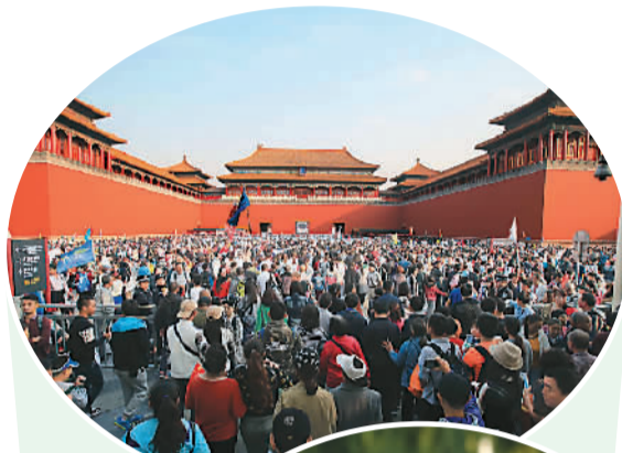
▲国庆长假期间, 众多中外游客来到北京故宫参观游览。

国家旅游局的统计显示: 游客出行需求呈多样化。城市休闲、乡村旅游最受欢迎, 假日旅游方式已从传统的观光型向观光休闲复合型转变。散客自驾游、自由行成为主流。黑龙江部分城市自由行比例占七成以上, 预订一日游、门票、交通用车等服务的比例明显增长。福建泉州自驾游比例达到83%以上。承