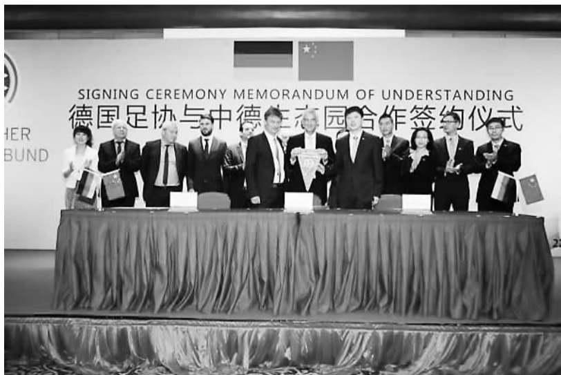
德国足协、德国国际合作机构牵手中德生态园。

绿色低碳的生态底色，以“德国标准”引领发展路径……中德青岛生态园注定不是一个平凡的园区。作为新时期中德两国开放合作的重要平台，中德青岛生态园致力于建设德国标准、国际特色、产城融合的生态园区，打造“一带一路”中德绿色发展的新符号，已成为中德合作的典范。 要绿色低碳，很重要的一个方面是标准的选择。中德生态园借鉴德国莱茵模式，先行建立了可量化的40项生态指标，并与世界上最严格的可持续建筑认证体系——德国DGNB标准建立合作，对园区建筑进行可持续认证。而且，园区项目筛选坚持“三个不要”原则：达不到生态标准的不要，不是绿色产业的不要，没有核心竞争力的不要，以“德国+”引