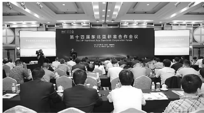
第十四届东北亚标准合作会议现场。

在人才建设上，青岛将推动青岛大学等高等院校设立标准化工程本科、硕士专业并与国外高等院校开展国际标准化人才合作培养；建设和开发青岛标准馆藏文献资源，开展标准化核心价值理念等文化研究；依托企业、行业和专业部门，建立健全标准化专家人才库。