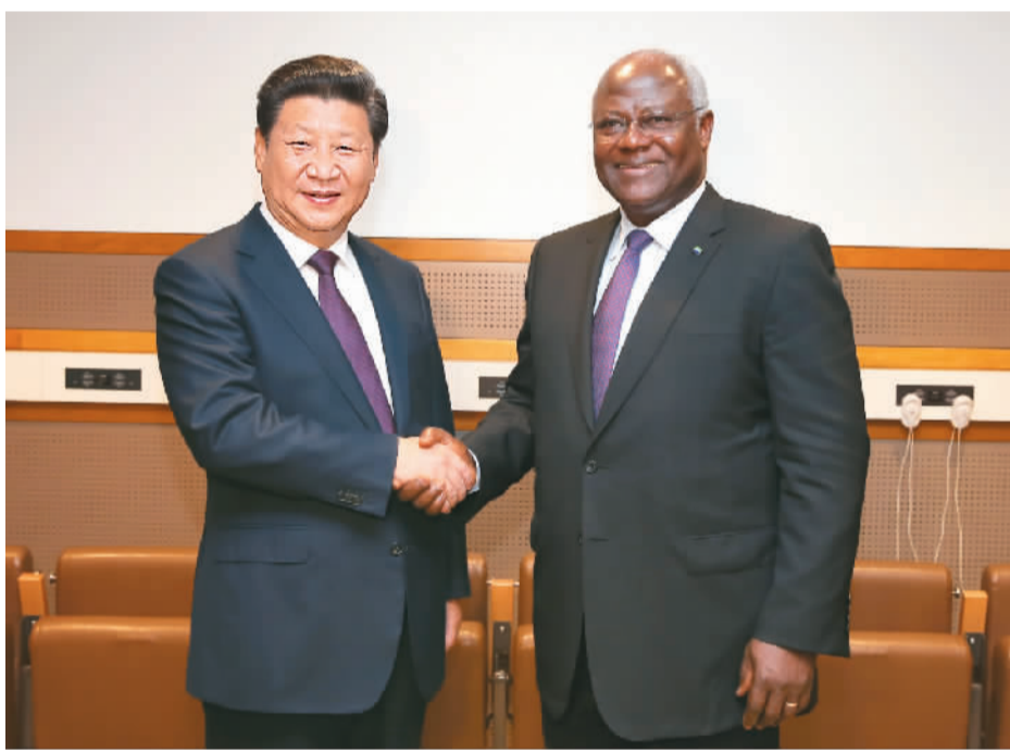
图为习近平会见塞拉利昂总统科罗马。

习近平指出，中非合作论坛峰会将于今年12月上旬在南非举行。这将在非洲大陆举行的首届中非峰会，意义重大。中方欢迎科罗马总统出席并为峰会成功召开