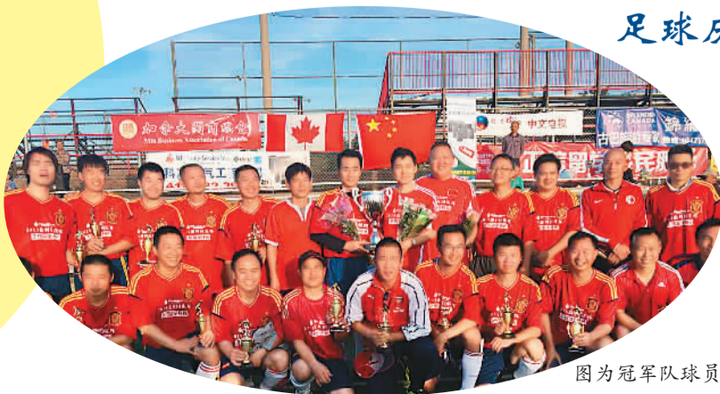
图为冠军队球员合影。