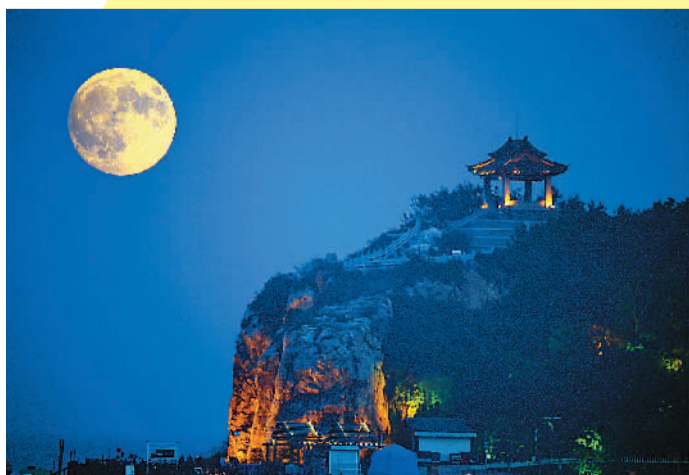
北戴河 海边赏明月