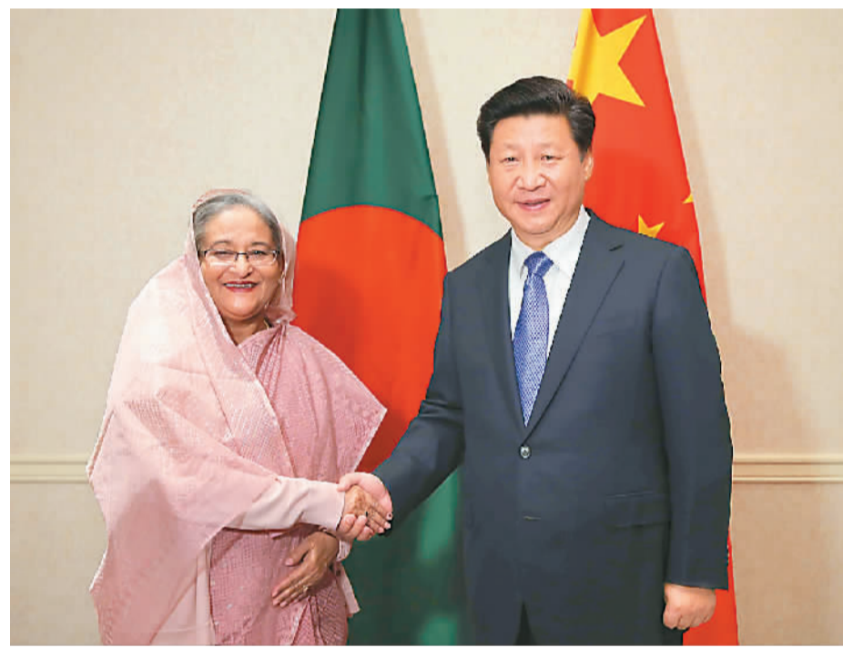
图为习近平会见孟加拉国总理哈西娜。