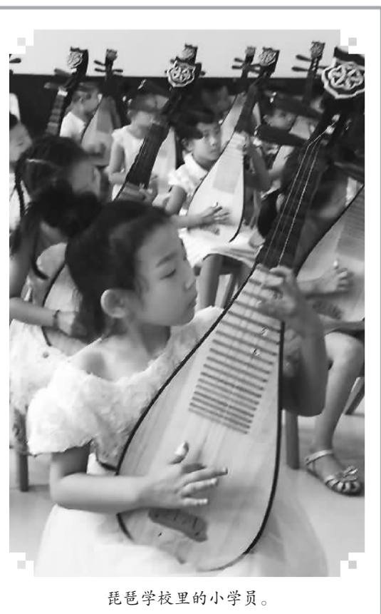
琵琶学校里的小学员。

日前，我到吉林辽源采访，有一个意想不到的收获。谁说东北只有粗犷豪爽的大秧歌和二人转，殊不知，细腻婉转的琵琶就深深根植在白山黑水间。