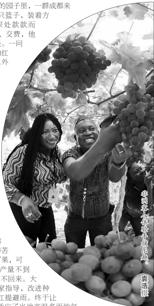
非别处人，依身手摘葡萄。

双流的农耕之美，其实源远流长。相传古蜀国的第一个国王蚕丛，率部落从岷山迁移至此，建立第一个都城，便开始教民蚕桑。今天的双流人，继承先人开拓创新的品格，不但让脚下这片土地，结出了新的果实，而且开拓出农业与旅游业融合发展的新模式，创造出新的农耕文明。品尝着甜美的葡萄，我们真要为双流翘起大拇指。从葡萄农庄回到黄龙溪镇，见街上卖葡萄的小摊，摆着紫黑色的“香悦”。尝一尝，既甜又香。一问价，1市斤才要5元。称了一小箱，带回来，全家皆大欢喜。