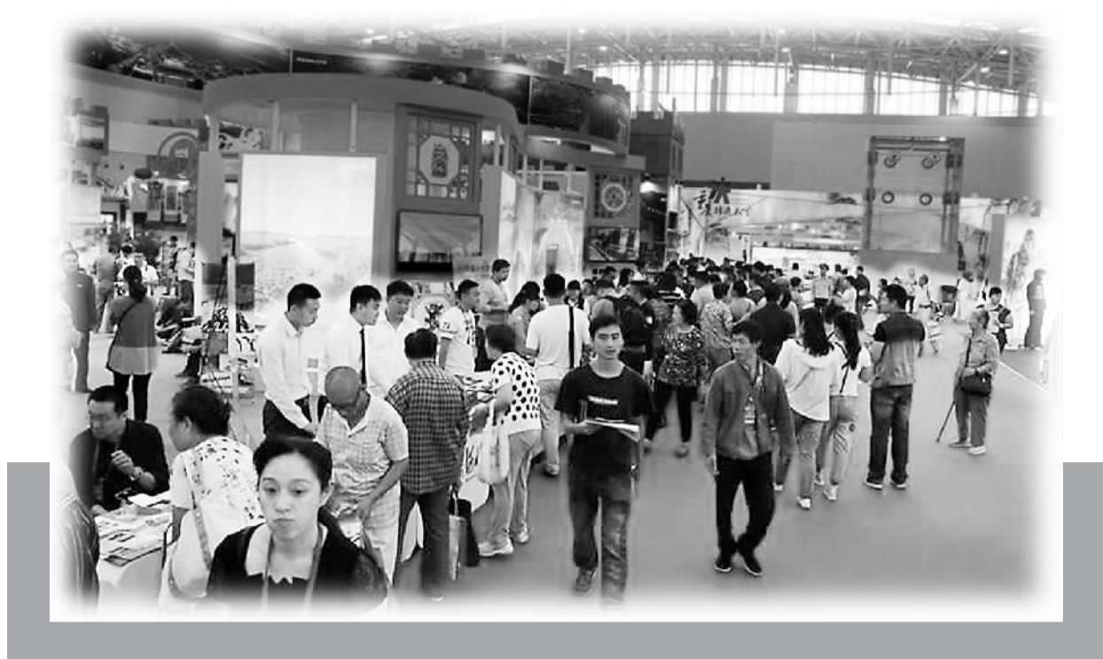
2015 中国旅游产业博览会现场。