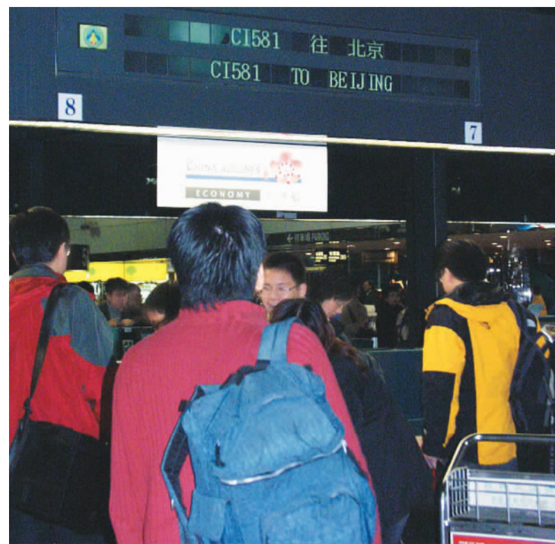
桃园机场是台湾最大的机场，也是不少重大事件的发生地。图为2005年1月29日，台商春节包机在两岸直飞，桃园机场自建成后首次挂出“北京”的航班号。

据介绍，该机场每天平均有570个航班起降，单跑道运作每小时能起降30架左右，也就是说，这一条跑道每天要有19个小时满负荷运转，跑道头随时会有航机排队等候起飞，等候时间少则30分钟，最多时90分钟才能起飞；而等候降落的航班在机场上空绕六七圈是家常便饭，记者本月初赴台驻点时，航班在机场上空盘旋了四五十分钟才降