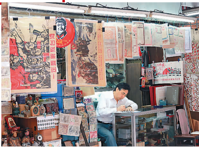
香港古董街出售旧货的摊档。

治的地区，在独立建国或回归祖国之后必须完成的任务和必然经历的过程。香港“去殖民化”的任务要从香港基本法的实施开始，第一，要依据香港基本法完成原有法律的主权转化；第二，要改变政权机构效忠对象；第三，要立法禁止危害国家主权的行；第四，行政管理和司法审判要正确理解香港基本法，不能纵容危害国家主权、安全和发展利益的行为。总之，就是要把法治意识和国家主权意识结合起来，不要把两者对立起来。