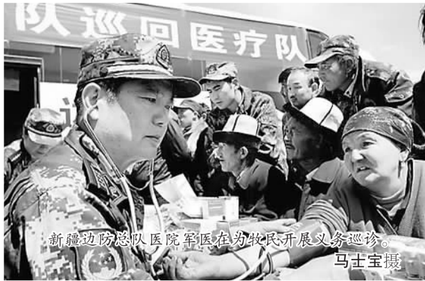
新疆边防总队医院军医在为牧民开展义务巡诊。马士宝摄