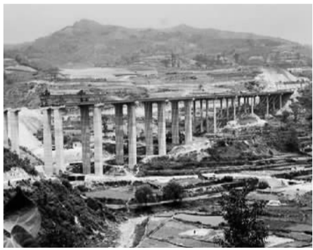
兵团建工集团承建的陕西小河水安康高速公路牛岔湾大桥。

成绩很快显现，近年来，随着科技创新和企业综合管理信息系统的建设，建工集团提升了市场开拓能力和市场开发层次。