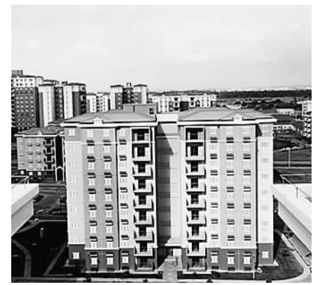
兵团建工集团承建的安哥拉“凯兰巴、凯西亚”房建工程。