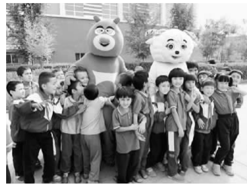
柯坪县湖州双语小学学生欢乐游戏。

近两年，西北油田投资400余万元在柯坪建成可容纳300名儿童的现代化双语幼儿园和3万平方米的农贸市场，建成20座“便民桥”；邀请乌鲁木齐空军医院的医疗专家到柯坪县为村民义诊600余人次，发放常备药品2万余元；建设950平方米的便民活动中心及配套公用房。