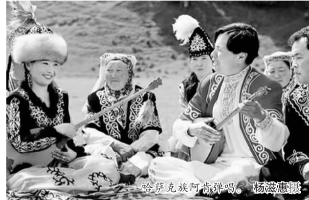
哈萨克族阿肯弹唱。

日前，首届“丝绸之路木垒菜籽沟乡村文学艺术节”在木垒书院颁奖，著名作家贾平凹摘此殊荣。被誉为最接地气文学艺术奖的木垒颁奖，寓意着木垒书院将散落于民间的艺术瑰宝串成一串光彩夺目的“珍珠项链”，扛起乡村文化的大旗。