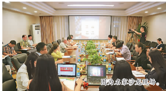
图为名家沙龙现场。