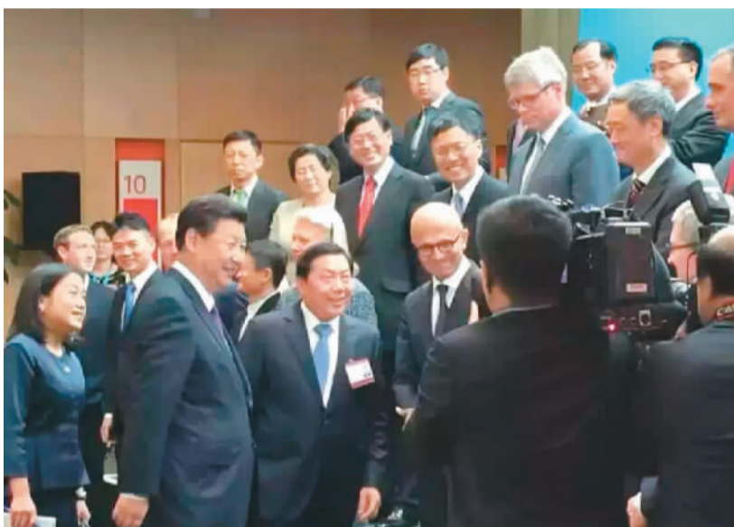
图为习主席会见第八届中美互联网论坛代表

抵达现场、欢迎人群、晚宴菜单……在微信上，众多媒体账号以及学习粉丝团等草根用户向网友全景式地展示了习近平的访美细节。而在大洋彼岸，“推特直播”也在同步进行：习近平讲话的英文稿、手举“欢迎习主席”的华侨华人……这些生动的细节，在两国的社交媒体互相流动，烘托出了访的友好氛围，也凝聚起了两国人民的情感。