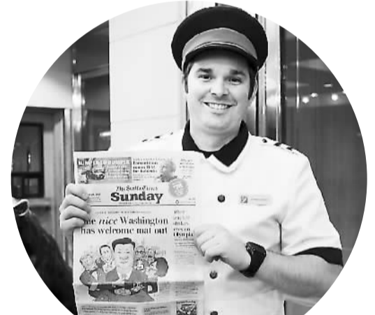
9月21日晚，西雅图市中心一家酒店，一位门童展示了《西雅图时报》头版对习近平即将访美的报道。

斯坦福大学弗里曼-斯波格利国际问题研究所特约研究员托马斯·芬加说：“我希望并期待两国