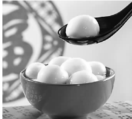
汤圆虽好，不宜多食。

秋分期间，一些地方还有挨家送秋牛图的习俗。所谓秋牛图，是把二开红纸或黄纸印上全年农历节气，还要印上农夫耕田图样。送图者都是些民间善言唱者，主要说些秋耕和吉祥不违农时的话，每到一家更是即景生情，见啥说啥，说得主人乐而给钱为止。言词虽随口而出，却句句有韵动听，俗称“说秋”，说秋人便叫“秋官”。