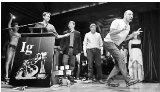
颁奖现场，获奖研究者也装上了“假尾巴”，演示了恐龙走路的姿态。

开车兜风会有意外收获？这次的“诊断医学奖”就用实验告诉你怎样不去医院就能预测阑尾炎。英国的研究团队发现，开车经过减速带，如果在震动下你的下腹部没有疼痛感的话，则说明你没有阑尾炎。在一项对101名患者的调查当中，33—34名阑尾炎患者报告说他们开车经过减速带时会感到疼痛，有“咯噔”一下的感觉。这种“开车诊断法”被证明是有效的，提醒人们对身体需要随时注意哦。