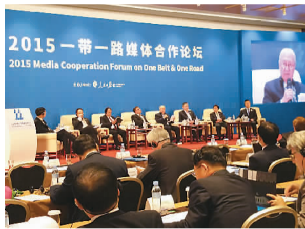
▲ 活动分论坛会场。 ▶ 与会嘉宾认真听讲。

人民日报社社长杨振武在致辞中表示，今天我们所处的环境和面临的挑战，比以往任何时候都更加需要我们结成命运共同体。中国既是“一带一路”的倡议者，也是命运共同体的倡导者，更是坚定的践行者、推动者。站在人类命运共同体的新高度，加强合作、增信释疑、汇聚认同，为“一带一路”注入更多正能量，使这