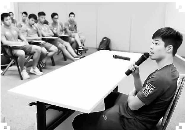
近日，有亚洲百米“飞人”之称的中国田径选手苏炳添（右）在香港体育学院与中国香港田径选手互动交流，分享个人跑步及训练心得。