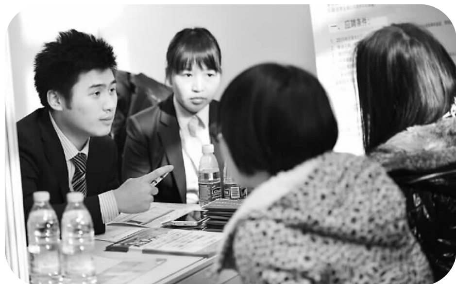
在“职为你来”中外企业校园行”公益活动现场,某外资企业招聘人员正在对求职者进行初步面试。

伴随着“留学潮”和“归国热”,越来越多的海外留学人员在出国深造以后选择回国求职。截至2014年底,中国出国留学人数达351.84万人,其中,回国人数占一半以上。仅2014年就有36.48万人回国,相当于2011年的30多倍。