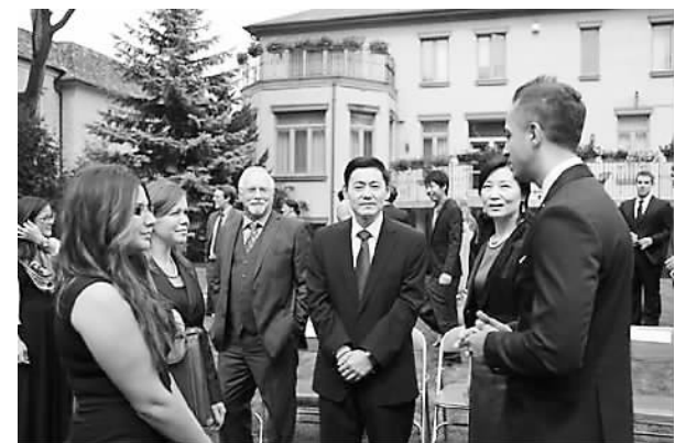
留华学生们和薛冰总领事夫妇及安省学生交流项目主管交谈。

在中国驻多伦多总领事馆近日举行的加拿大留华学生首次联谊聚会上，来自多伦多大学、渥太华大学、滑铁卢大学、约克大学等加拿大高校的留华教授、学者、学生等50多人在总领事官邸共聚一堂，畅叙在华留学的经历和校园生活的趣事，充满了浓郁的情谊和亲情。