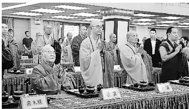
2015年9月4日，海峡两岸暨港澳佛教界纪念中国人民抗日战争暨世界反法西斯战争胜利70周年祈祷世界和平法会现场。

1982年农历二月初八，16岁的学诚法师在福建莆田广化寺出家。“二月初八是释迦牟尼佛出家的日子，你今后必成正果。”监院法师