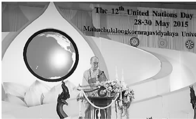
2015年5月28日，学诚法师在第十二届“联合国卫塞节”国际佛教交流大会开幕式上作主旨演讲。