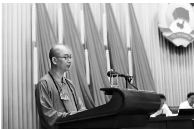
2015年8月27日，学诚法师在全国政协十二届常委会第十二次会议上发言。