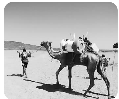
Arktek的独特设计使其可以经受骆驼运输这种方式。

实际上，Globalgood与澳柯玛联手投资研发和生产“生命之桶”，原因在于发展中国