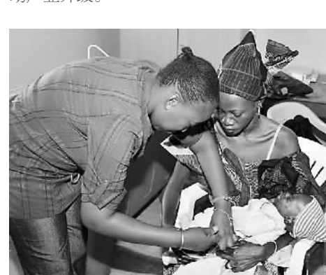
非洲居民接受从Arktek中取出的疫苗接种。

目前，澳柯玛集团已经拥有15000余家零售终端，营销网络遍及中国所有省区，在东北、西北、华北、华东等优势市场区域占据着主导地位，同时拥有青岛高端制冷产业园、河南电器产业园、中南、西南制冷产业园也在规划筹建中。伴随着生产基地的全国布局，澳柯玛将同步进行生产设备的改造和升级，大力引进现代化、自动化、高精度的生产设备和工艺，推动产业升级。