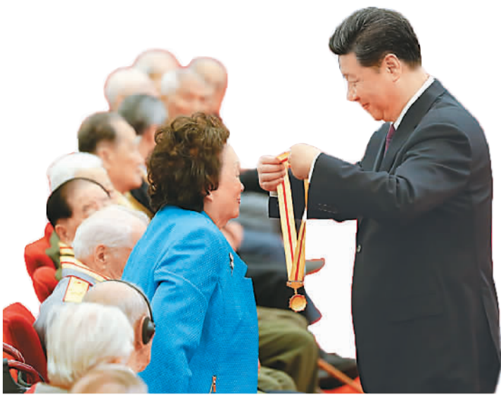
2015年9月2日上午，国家主席习近平向陈纳德将军的夫人陈香梅女士颁发纪念章。