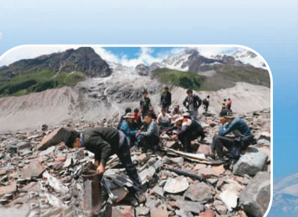
在西藏林芝易贡乡，探灵队员对二战时在“驼峰航线”上坠毁的飞机残骸进行打包运输。（资料图片）

“怎能忘记旧日朋友，心中能不怀恋……同声歌唱友谊地久天长。”在央视《开学第一课》的节目现场，当记者看到美国飞虎队员的后人与参与营救飞虎队的中国抗战老兵共同唱起《友谊地久天长》时，飞虎队来华时中美并肩作战的场景仿佛历历在目，中美之间因“飞虎队”而结下的友谊从历史中走来，并向未来继续延伸。