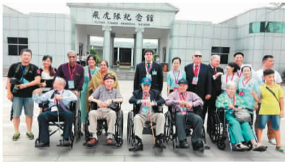
2015年9月6日，多位美国飞虎队员及家属参观湖南芷江飞虎队纪念馆。

这样的故事还有很多。例如飞行员唐纳德·克尔在轰炸香港启德机场时飞机被击落，跳伞后被香港民众以及增援的东江纵队战士所营救；而乔布在采访中提到，一位飞虎队员被中国村民救起后，为了转移日军的注意力，村民穿着这名飞行员的靴子在地里行走，留下一串通向村外的脚印，成功地让日军离开这个村子，保护了他的安全。