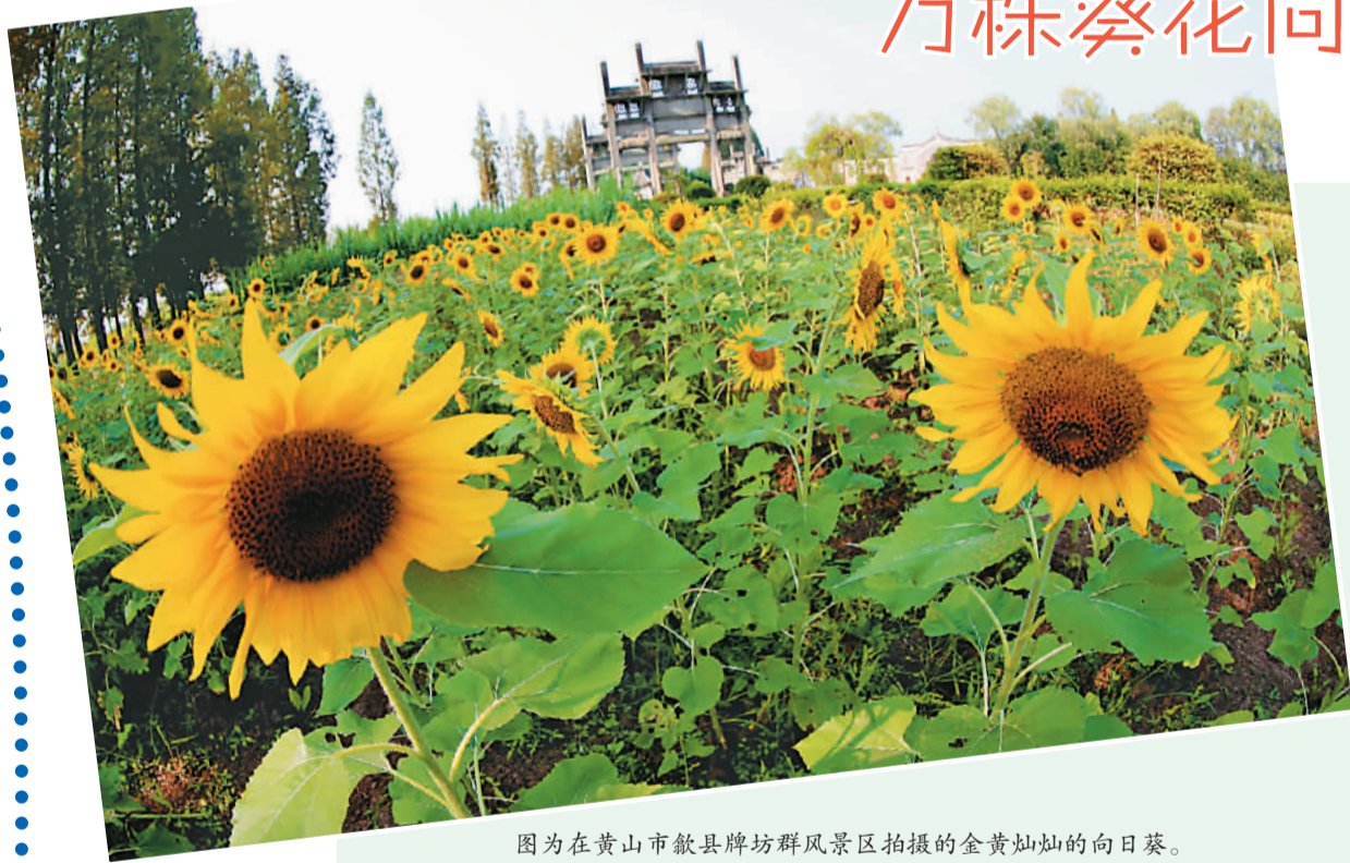
图为在黄山市歙县牌坊群风景区拍摄的金黄灿灿的向日葵。