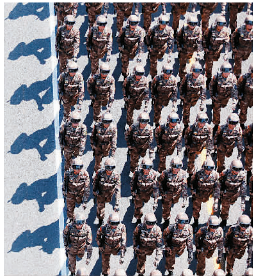
阅兵式上的英模部队

在裁军的意义上，韩国纽西斯通讯社的总结一针见血——原本被视为宣扬“大国崛起”的阅兵式却宣布了裁军，这多少令人意外，显示出中国对于军事现代化的强烈自信。