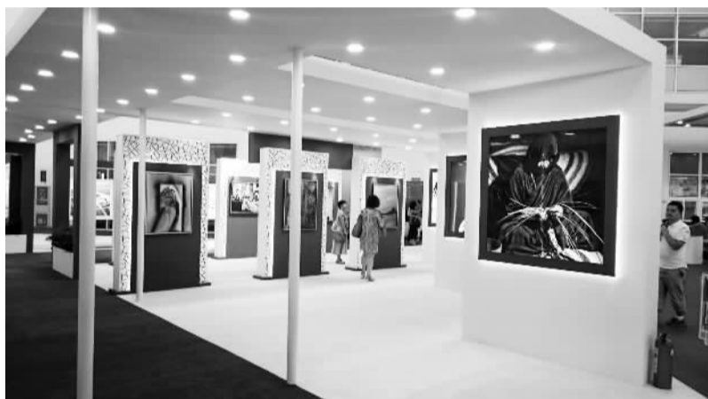
阿联首主宾国展台

今年图博会聚焦童书出版的创举，极大地激发了现场观众对童书的热情。带着孩子参观国际绘本展的