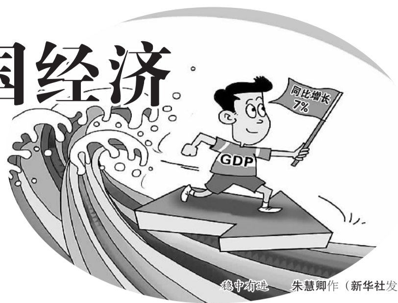
稳中求进 朱慧卿作