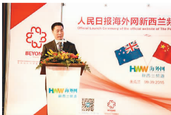
中国驻奥克兰总领事牛清报发表致辞。