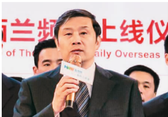
中宣部副部长孙志军致辞。

9月9日,海外网在大洋洲的第一个国家频道——新西兰频道正式上线,标志着人民日报海外版实施“报网融合、全球本土化布局”发展战略又向前跨出了一大步——