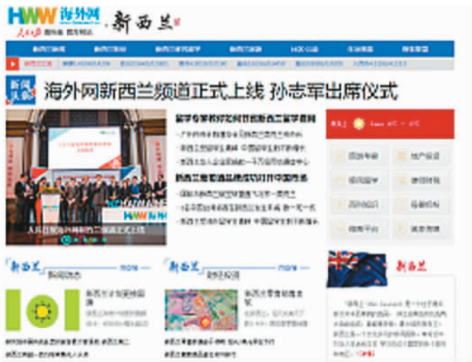
海外网新西兰频道截图

眼下,北京正是金秋,奥克兰则是初春。春天是播种的季节,春天播下希望的种子,秋天就能拥有收获的喜悦。新西兰频道上线,是人民日报海外版和海外网为新西兰华侨华人服务的一个新起点,更标志着人民日报海外版实施“报网融合、全球本土化布局”发展战略又向前跨出了一大步。