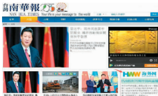
台湾南华报刊官网设立“海外网抗战胜利70周年阅兵直播专区”。

此次阅兵直播的成功,充分展示了海外网记者的创造力——前方7人分布在不同的报道点,每人需单兵作战,自采自写;内容团队的凝聚力——直播运营组假日无休全员出动,最长工作时间达35小时;跨部门的协作力——跨6个部门进行协同,召开联席会议十余次。我们相信,海外网定可借助这次阅兵直播成功之东风,突出自身特色,融会互通,再创佳绩。