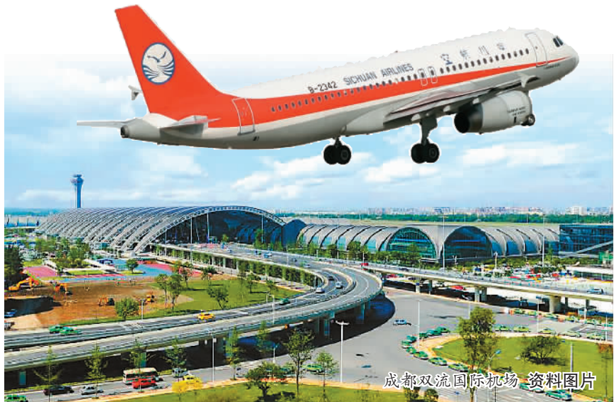
成都双流国际机场 资料图片

20年前，考古工作者在新疆和田尼雅遗址发现了一座东汉末至魏晋时期的古墓，里面有一块色彩艳丽、上面绣着“五星出东方利中国”的蜀锦。这块织锦证明了千年之前地处中国西南的成都与西域之间已经有了商贸、人员的往来。