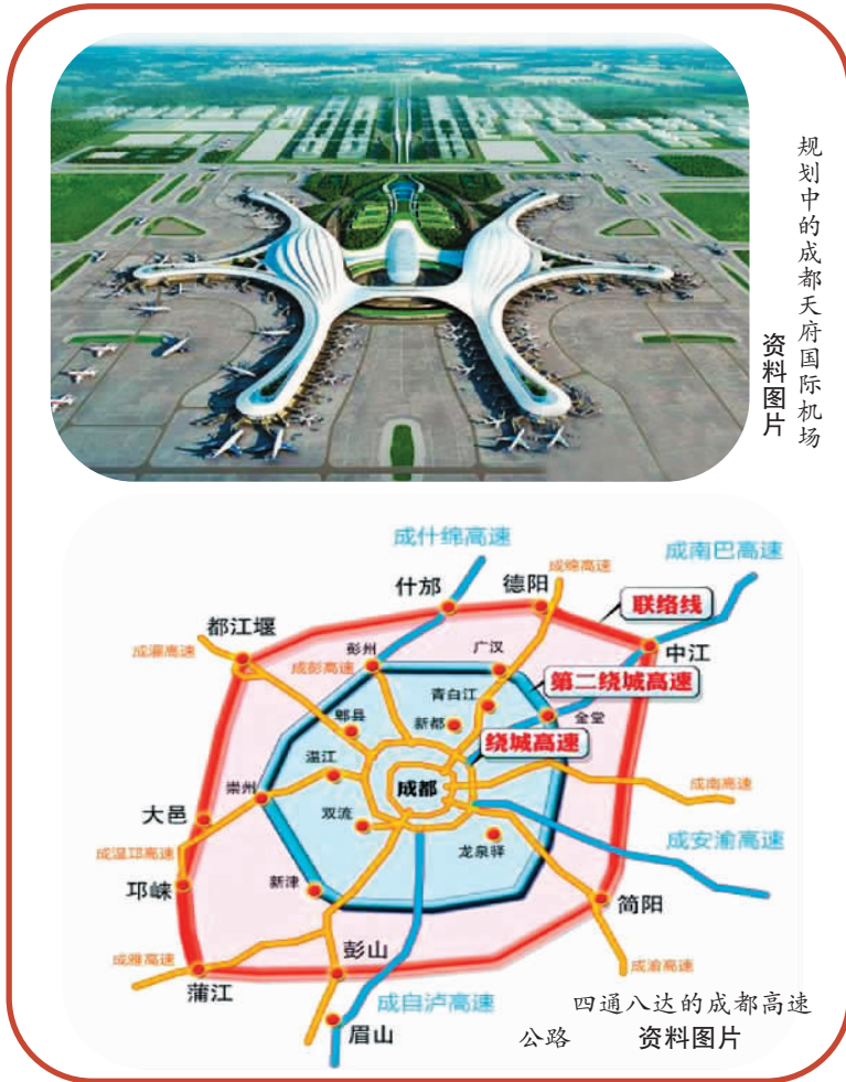
规划中的成都天府国际机场 资料图片