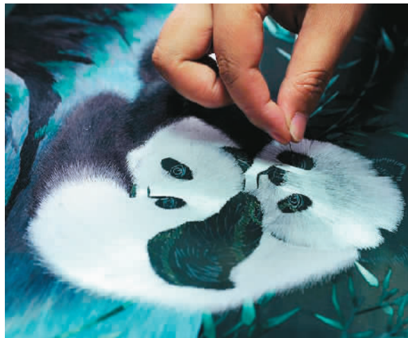
蜀绣上的大熊猫 资料图片