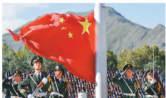
庆祝大会举行升旗仪式。