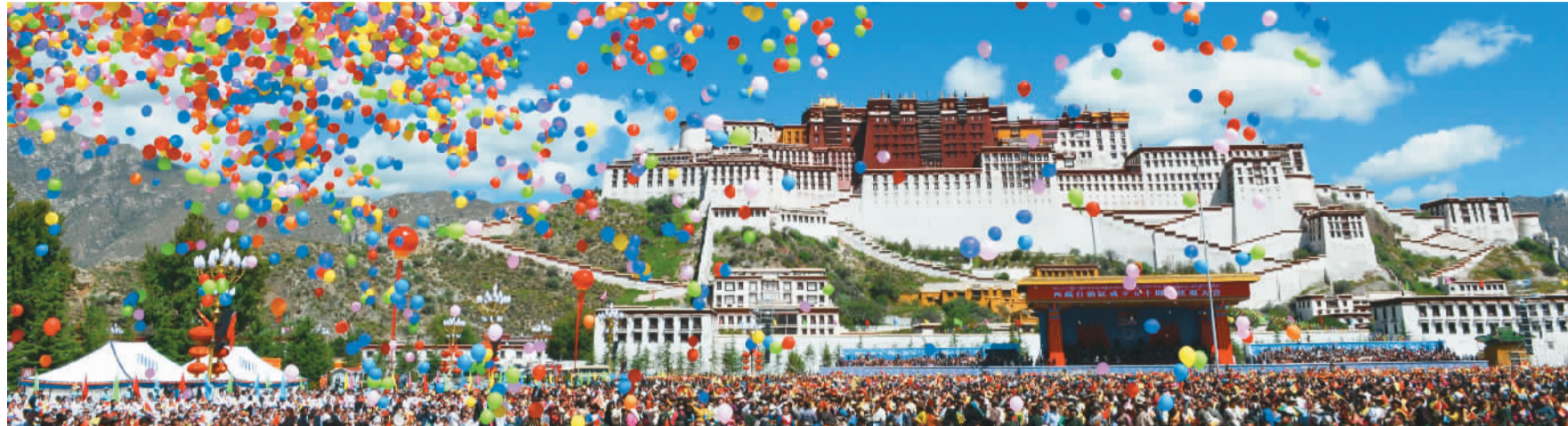
图为庆祝大会现场。