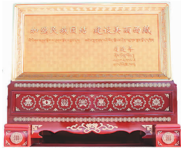
图为习近平题词“加强民族团结 建设美丽西藏”贺匾。