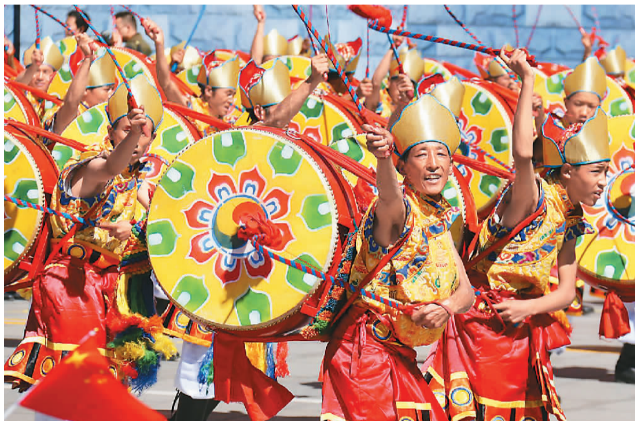
鼓舞方队经过庆祝大会主席台。