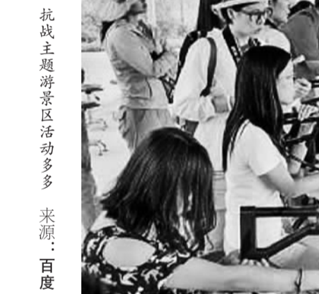
抗战主题游景区活动多多

5月13日，国务院宣布今年的9月3日是中国抗战胜利70周年纪念日，安排放假1天。为此，旅游企业特别推出了抗战胜利70周年主题旅游产品。来自携程网的统计显示，9月3日放假前后的一些旅游产品出现预订热潮。“往年暑期过后的9月是旅游淡季，旅游企业都忙着为‘十一’小长假作准备，而今年9月初的小长假使得旅游市场淡季不淡。”途牛旅游网相关负责人介绍，抗战主题游着实催热了9月旅游市场。