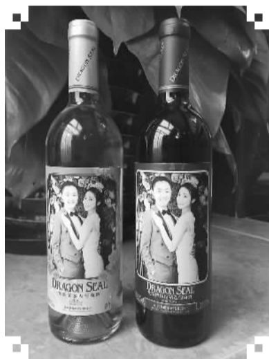
定制的婚礼用红白葡萄酒。

所有婚礼上，重头戏之一就是音乐。我俩决定，婚礼上出现的所有音乐，都要由自己完成。我学过10年的萨克斯，娜娜则是流行音乐的发烧级爱好者，因此，我们决定要把自己的音乐天赋和才华充分展现出来。我们给婚礼选了一个主题曲孙楠的《幸福牵手》。娜娜说：“这歌太棒了！写出了咱俩12岁相识，19岁相恋，25岁结婚的全过程。”头上的娜娜接着说：“干脆咱俩多录几首歌，让婚礼现场自始至终地播放我们演唱的音乐。”我也灵机一动：“干脆有几桌来宾，咱们就录几首歌，让每一张桌子