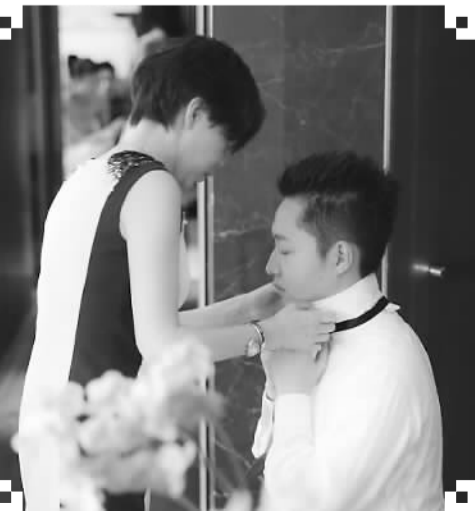
婚礼开始前，新郎妈妈为新郎整理领结。

对于每一对新人而言，婚礼一定是一场幸福和温馨的盛宴。短短数小时的婚礼，需要半年甚至更长的时间来筹备；筹备过程中，新人免不了做出一个又一个选择：种类繁多的婚庆市场，究竟如何取舍？究竟如何取舍？这一取一舍间，考验的是新人的智慧，体现的是新人的品味。我俩可以骄傲地说：我的婚礼，由我做主！