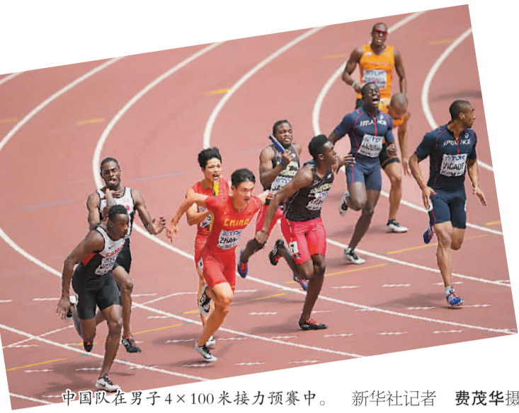
中国队在男子4×100米接力预赛中。