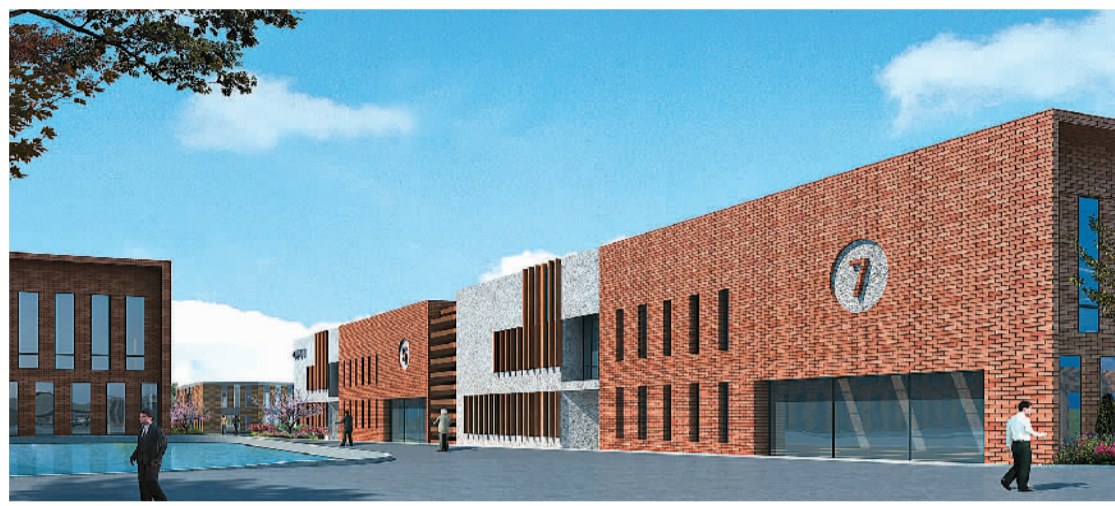
◀ 淄博功力机械制造新工厂设计 ▼ 新华医疗科技园新工厂设计

比如，新华医疗的建筑为其海外拓展起到巨大的推动作用。国外的客户到新厂区参观时受到极大的震撼，对新华医疗的产品质量有了更高的信任度，“企业形象”具有特殊的促销功能。为了与国