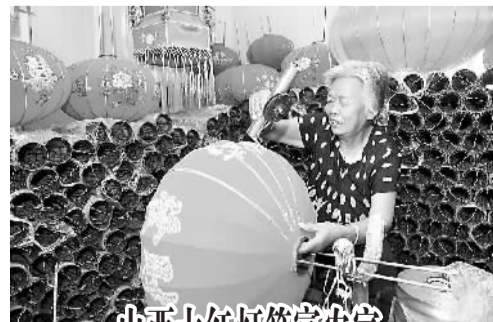
山西大红灯笼富农家

据悉，在沙特政府部门的授权下，JSG已寻找到200个以上中国企业进行合作，中国项目、中国产品与中国资格体系正在沙特受到广泛认可。在“一带一路”战略下，中国企业“走出去”之路日渐变宽。