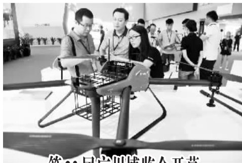
第23届广州博览会开幕

为扶持小微企业发展，财政部、税务总局曾于去年9月发布《关于进一步支持小微企业增值税和营业税政策的通知》，规定自2014年10月1日至2015年12月31日，对月销售额2万元至3万元的增值税小规模纳税人和营业税纳税人，暂免征收增值税和营业税。