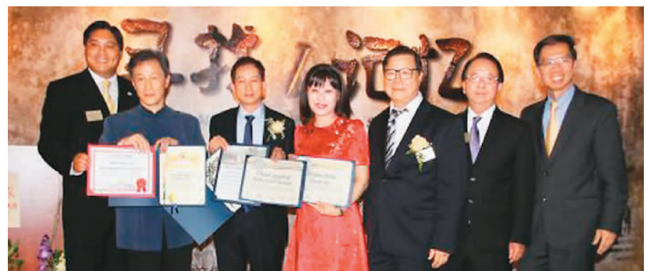
大型人文纪录片《金山梦——寻找·道钉记忆》部分制作人员在首映礼上合影

死者已矣，生者当如斯，只有铭记这段历史，那份屈辱和苦难才不会重演，我们才能更好地前行。