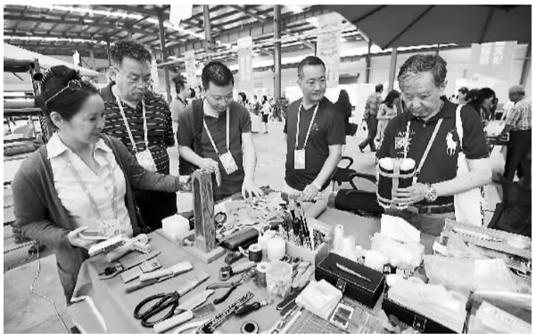
图为世界华文传媒论坛海外嘉宾参访贵阳联合智造创客空间。

如不少海外华媒人所说，今天的海外华媒不再只是一支在“异文化”中奋战的“孤军”，而已成长为国际舆论