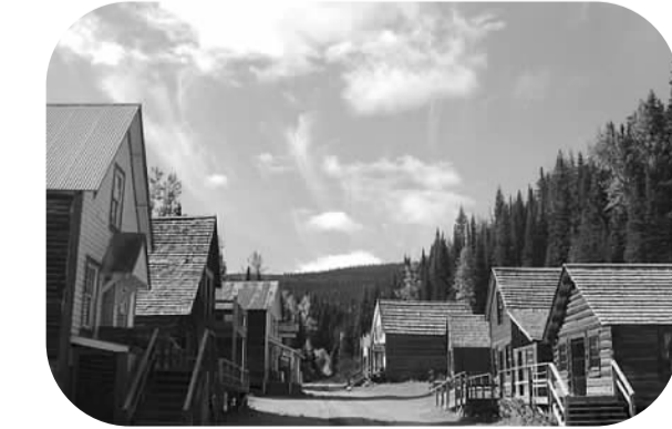
小图：卑诗省第一代“华埠”——巴克维尔。