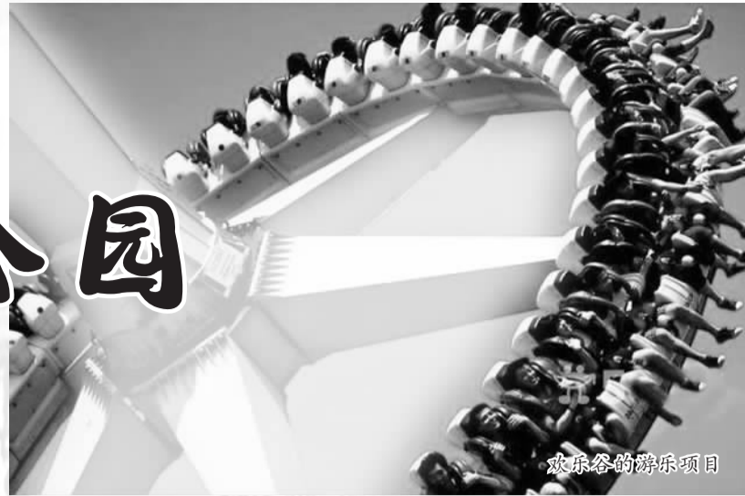
欢乐谷的游乐项目

暑期,全国各地的主题公园成了大中小学生们嬉戏欢愉的天堂。随着近日上海迪士尼乐园向世人揭开神秘面纱,发布六大主题园区及娱乐演出项目,更是点燃了炎炎夏日小伙伴们涌向乐园,分享属于自己年轻生命中独一无二的盛大嘉年华的激情。