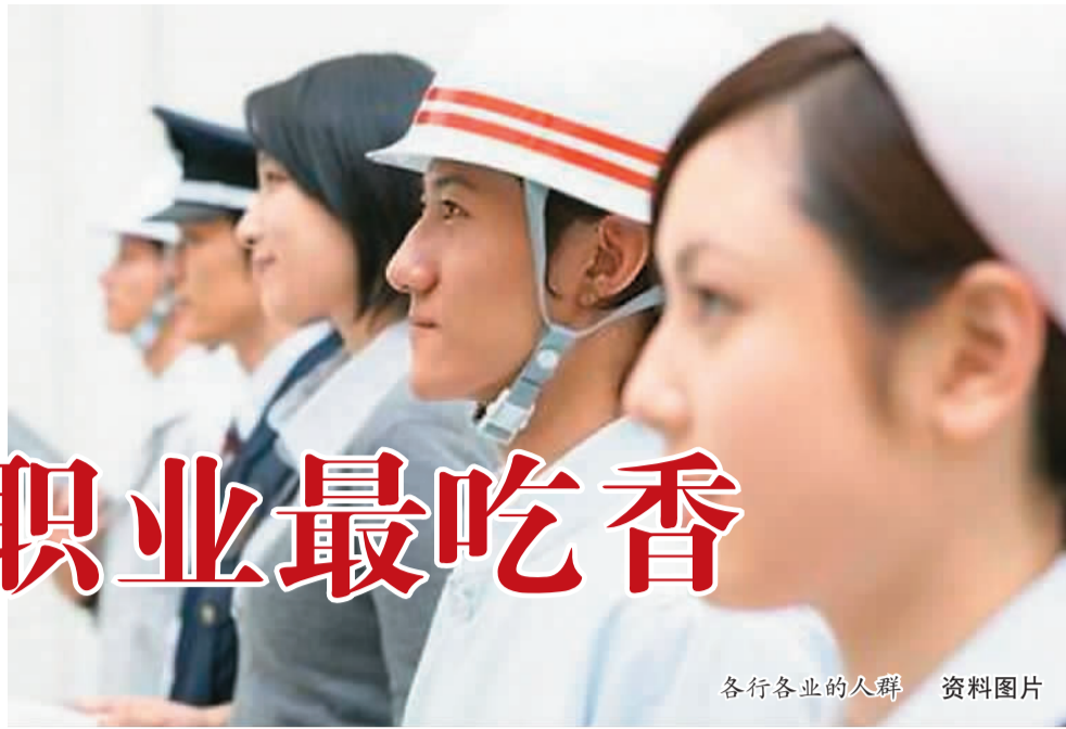
各行各业的人群 资料图片