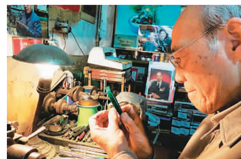
逐渐消失的钢笔修理师 资料图片

此外,业内人士指出,职业分类可以统一规划、有效规范职业资格设置,有利于国家职业资格框架体系的建立和国家职业资格目录清单管理制度的实行,从源头上遏制职业资格设置乱象,维护劳动者的合法权益,促进人力资源的有效开发。而未来,《大典》修订平台还会建立职业分类动态更新机制,对《大典》进行及时调整和补充完善。