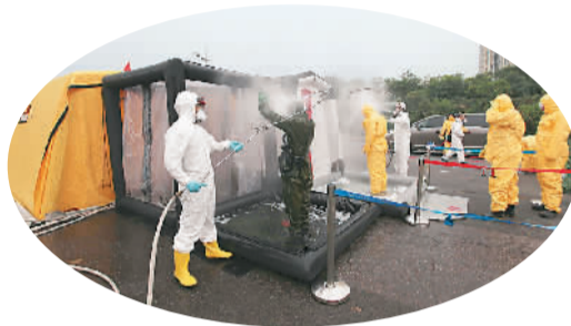
救援人员进行自身洗消。

此外，据国家海洋局通报，根据18日的监测结果，天津港港池内4个站位检出挥发酚，浓度较17日有所降低，最高为0.00477mg/L，低于第一类海水水质标准(0.005mg/L)。