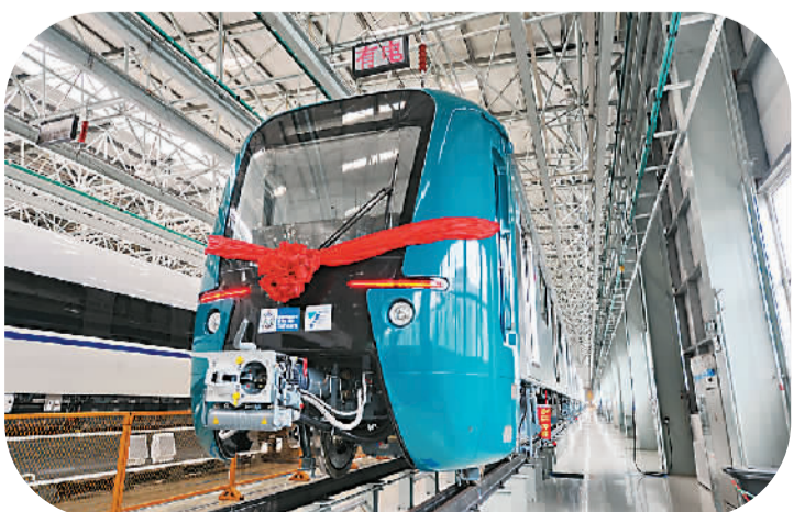
8月19日,由中国中车长客股份有限公司制造,服务巴西里约奥运会的最后一列电动车组在长客下线。至此,长客公司累计为巴西里约热内卢研制的100列电动车组已全部制造完工。