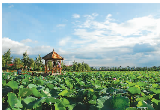
三圣花乡荷塘月色 资料图片

“当年走马锦城西，曾为梅花醉似泥。二十里中香不断，青羊宫到浣花溪。” 成都的花香曾让陆游为之痴迷和回忆。是的，这座被称为“蓉城”的城市，别名就来自于一则颇具浪漫色彩的传说：将成都定为都城的后蜀皇帝孟昶，有一宠妃，名“花蕊夫人”。相传，花蕊夫人特别钟爱芙蓉花，因此孟昶便令成都城内遍植芙蓉，尤其是城墙之上，“每至秋，四十里皆如锦绣”。 这大约是成都人系统打造生态之中最富传奇色彩的一则了。 成都人爱花，有赏花的习惯。市林业和园林管理局制作的二十四时赏花指南，就有颇多市民追捧。一月看梅，二月海棠、早樱和木兰，三月梨花、紫荆，四月桃花与桐花，五六月栀子，七八月荷花、紫薇，九月桂花，十月十一月赏芙蓉，十二月腊梅……在人民公园、百花潭公园等地，每年还会定期开办盆景展、菊花展、荷花展等专题展出，有许多展览已经持续了50多年。 一年四季，成都总是花香不断，在花朵的持续与定时轮换里，现代人与古人有了相同的嗅觉与视觉体验。 如果说园林花卉之盛，在某种程度上还得益于成都的自然条件与历史传统的话，那他们的另外一些做法，则是在现代城市化进程中的创举与坚守。毕竟，城市的发展，和生态的保护，一定程度上是本质矛盾的，是城市对自然的一种异化。 在成都的中心网状辐射式结构中，有两个圆环非常醒目：绕城高速和第二绕城高速。在成都的规划中，这两个“绕”，是非常重要的“环城生态保护带”；他们采用“环形+楔形绿地”的方