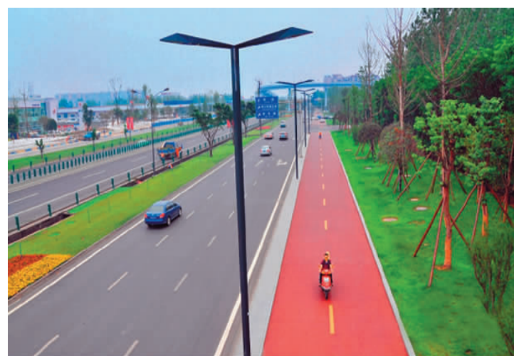
成都道路上植被丰富且宽阔的绿化带 资料图片

现在，三圣花乡传统的“农家乐”，有许多甚至已经转变为“艺术家”，人们不仅可以在农家小院里品尝到特色餐饮，还能在其中发现书画艺术展厅，欣赏山水画、竹雕、收藏品、文创产品和音乐。 热爱生活、敬畏自然的成都人，正在现代化的潮流中探索新路。在他们心中，时刻记的是那个如诗如画、山水相依、伸出手就能触碰到自然的成都。