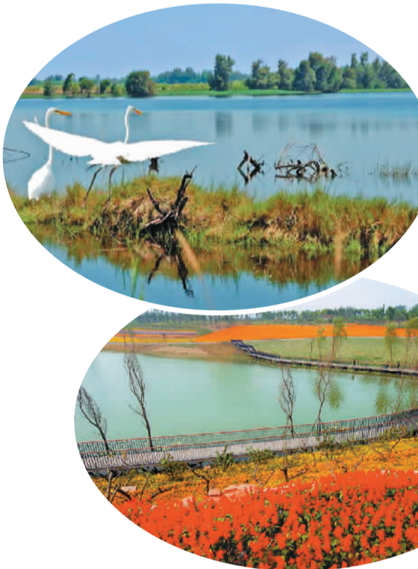
白鹭湾湿地如今已成为成都市民休闲健身的重要去处 资料图片

成都高新区，白领最密集的区域。白天，这里的商业氛围、职业气息浓厚，人们步履匆匆地走在钢铁与玻璃的建筑物之间。 而当他们下班之后，很多人会选择驱车向南。20分钟之后，他们就可以到达成都绕城高速的边缘。在那里，有一片湿地，叫白鹭湾。 很难想象国内还有哪个城市像成都一样，在没有完全离开市区的地方，就有这样一片巨大的湿地——总面积超过13公顷的湿地公园，从北门进去，无论向西还是向东，骑车转半圈，总需要一个多小时。一路上，有小片的池塘，有大片的开阔水域，村民乘船在水面上作业；有起伏的丘陵，也有躲在树林后面的荷塘；水面上，有成群的野鸭排队凫水，天空中，不时有白鹭翱翔而过。 记者是在一个周一的下午到达白鹭湾。租自行车的老板告诉我，今天人不算多，周末的时候会更多。但是一路上，情侣、家人、朋友、学生们三三五五说笑而过，有的在散步，有的在骑车，还有人在绿道上跑步。还有年轻的学生背着画板，在山水之间写生。 如果没有事先了解，很难想象，这片湿地，是在原有湿地基础上改造的，而改造的对象，则是原来的“生活污水”——把污水引入湿地系统，通过几层降解，最终形成净化后的景观水。同时，湿地内大量种植的芦苇、香蒲、姜花等水生植物，不仅能进行生物净化，还能形成丰富的景观和生态，兼具实用与美感。 在离白鹭湾不远的地方，能看见绕城高速，看见高耸的铁道桥以及散落其间的农田和草地。只有在这里，思绪才会暂时地“跳出”，辨认出这其实是在城市近郊的一处湿地；但也凭着这样的距离，白鹭湾才成为成都市民休闲、踏青时最触手可及的自然之地。 比白鹭湾更近的是锦城湖。这个由4个人工湖组成的公园，现在是成都夜跑人的“圣地”。在成都大大小小的几十个夜跑团中，超过一半的人会选择这里，夜间