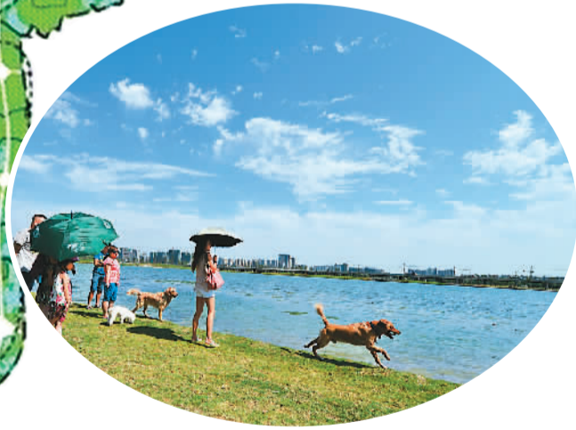
位于成都市区的锦城湖被称为“夜跑胜地” 资料图片

式，把绿地“楔进”城市。 事实上，成都意识到，必须有意识地控制城市无序建设，留下生态绿地，避免城市“摊大饼”式的发展模式。 现在，成都留下了187.15平方公里的生态绿地。这可不是在郊外、在下辖县城的绿地规模，而是在成都市内的生态绿地，是在高度城市化地区的生态绿地和开敞空间。要知道，成都最核心的中心城区面积只有598平方公里。换句话说，处于城市中的环城生态区，如果仅以经济价值论，是非常“值钱”、具有巨大的商业开发潜能的。 数字或许无法带来直观感受。但只要驱车在成都的绕城高速和三环路上走一走，就能感受到这一绿化带的珍贵——在成都市三环路这样的核心空间，路两旁的绿化带能拓展到50米的距离；而在稍远一些、全长85公里的绕城高速周围，这一数字则是200米。用一位成都园林工作者的话说，“城市发展到哪里，绿色就蔓延到哪里”。 稍微想象一下就可以明白，在一个GDP总量突破万亿元、常住人口超过1600万的大城市里，能做到这一点，殊为不易。为了做到这一点，成都在城乡结合部大力推行改造，恢复以往“看得见山，望得见水，记得住乡愁”的形态。 成都人非常珍视这一难得的生态区。2012年，成都市专门为环城生态区做了总体规划和地方立法，是全国第一个为生态规划立法的城市。2013年，成都还出台了《成都市绿地系统规划（2013—2020）》，预计到2020年，成都的绿地系统建设将达到国家生态园林城市绿化指标标准，实现城市绿化覆盖率45%、绿地率40%、人均公园绿地15平方米的目标。