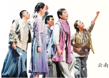
抗战音乐剧《国之当歌》在云南公益巡演。