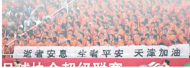
▲8月16日，山东球迷打出标语为天津鼓劲。